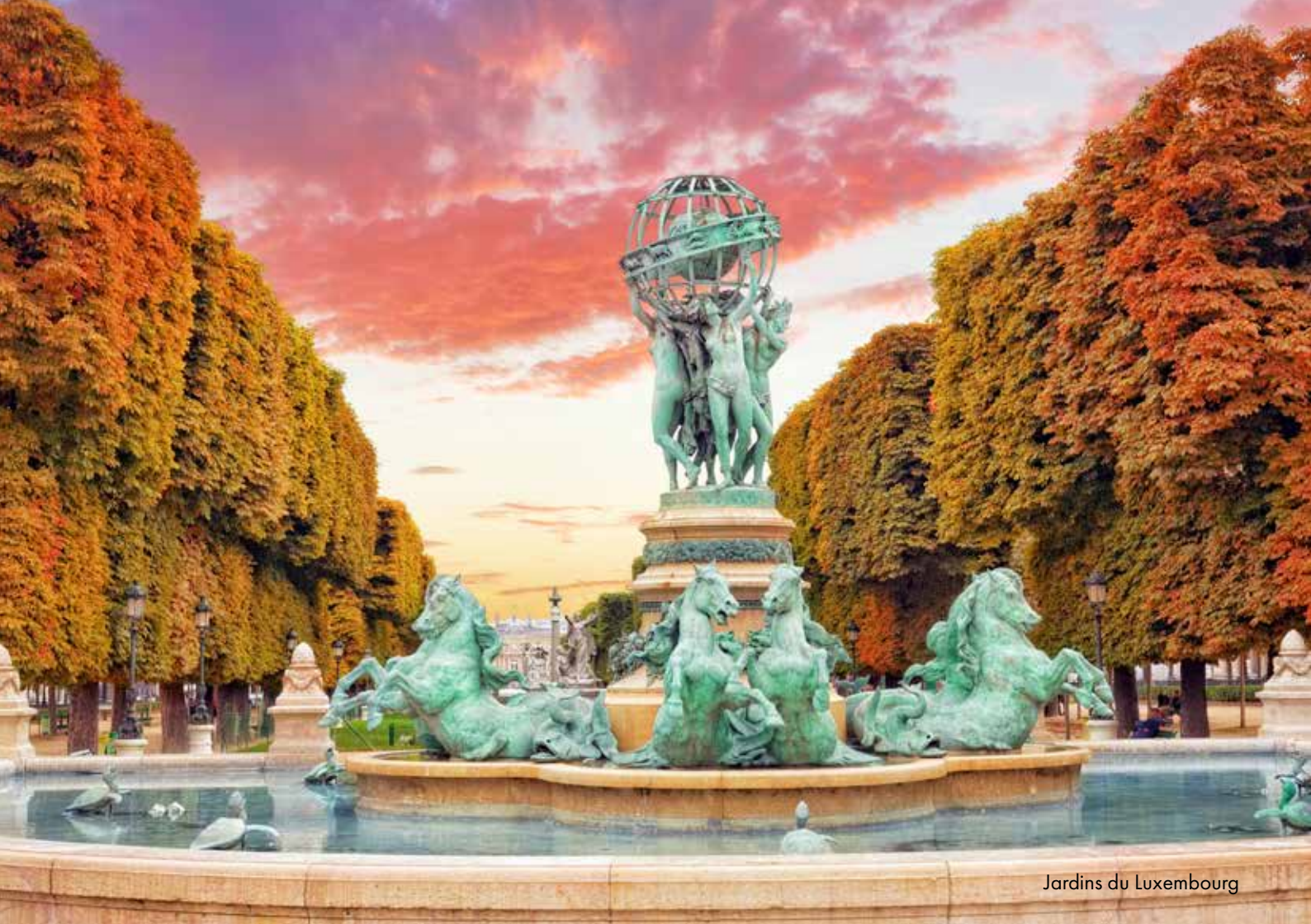
Jardins du Luxembourg