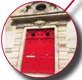
Ecole Pratique de Service Social

*Chambres doubles ou individuelles équipées d'un lavabo et accès wifi. La résidence comprend une bibliothèque, une buanderie en libre-service, un foyer et des cuisines accessibles.