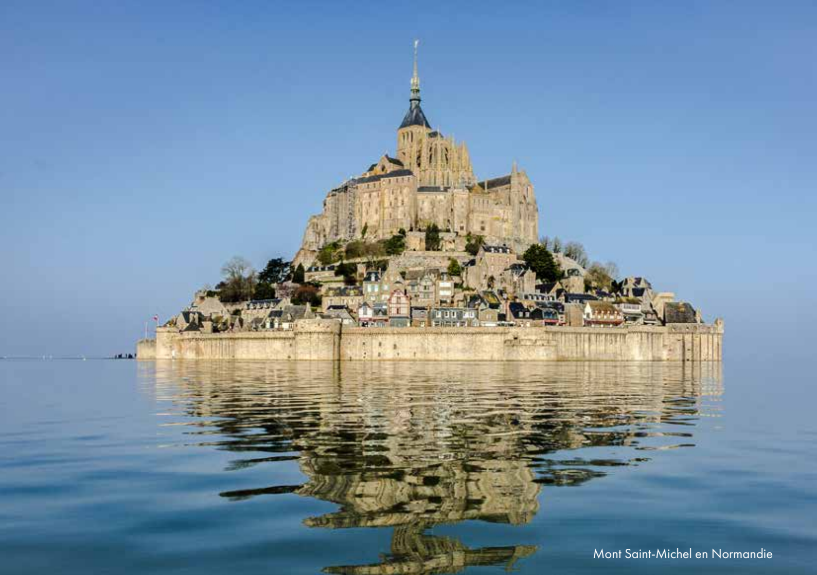
Mont Saint-Michel en Normandie